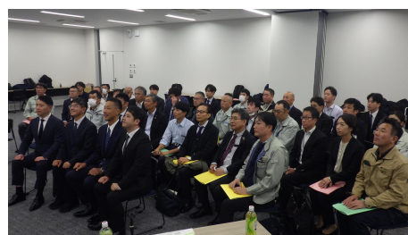
北陸インフラメンテナンスフォーラム 石川・富山ブロック小会議(R6年11月)