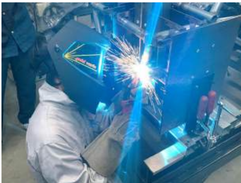
図1 アームステイ溶接

制作に関しては4月下旬の状態から再開したものの、活動時間が17:00~21:00の4時間しか確保できなかったためあまり進捗は良くない状況でした。加えて静的書類の提出時期が重なっていたため中旬まではほぼ手が付けられない状況でありました。22日から再開し6月30日時点でアームのステイが全て付け終わった状態となっています。したがってアースダウンは7月下旬に延期となりました。図1はアームステイ溶接の様子である。