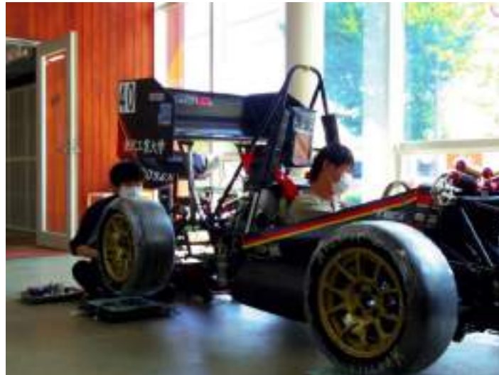
図 1 アライメント風景

現役生は 19model の試走をするために 20model のパーツ部品を 19model に取り付ける作業や、試走のために各自車両整備を行っていました。図 1 はサスペンション班のアライメント風景です。