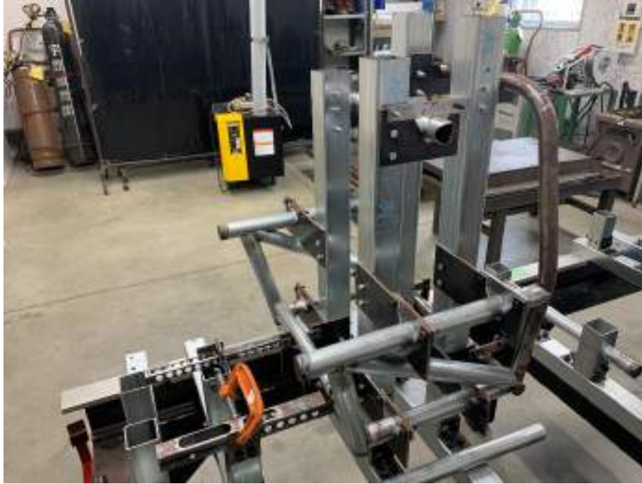
図5 フレームのフロントセクション