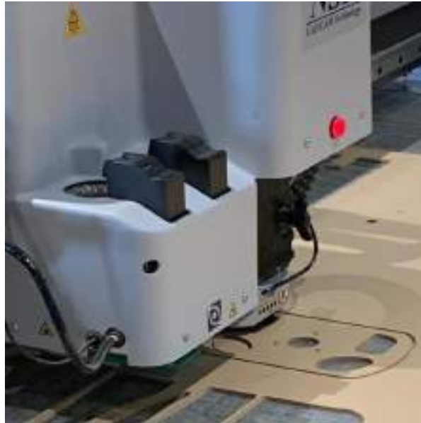
図3 カuttingマシンによる切り出し作業