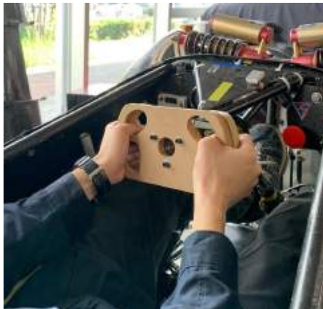
図4 仮取り付けによる使用感確認の様子