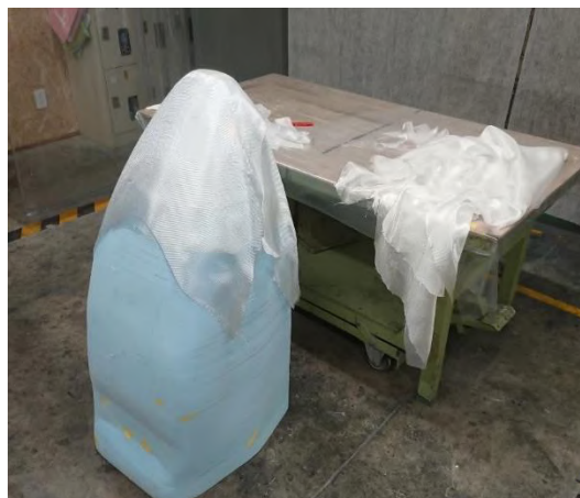
図2 ノーズ製作の様子