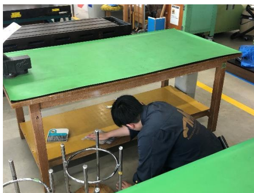
図4 夢考房大掃除の様子