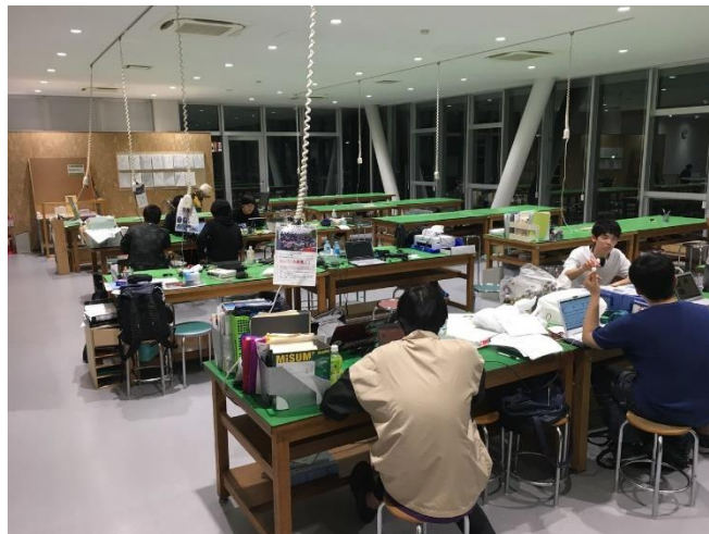
図2 コストレポート作成時の様子