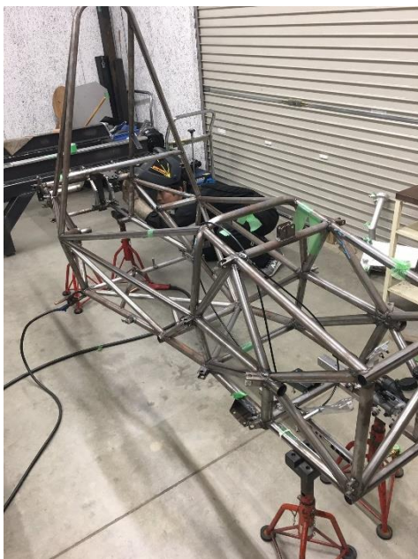
図1 フレームの最終溶接

5月の車両製作の進捗は、5月末にフレームをジグから外し、ジグ上にフレームがあり溶接不可能であった箇所を最終溶接を行いました。また、各パーツのステーの溶接も行いました。その後、各パーツの組付けを行いました。下記図1は最終溶接の様子です。