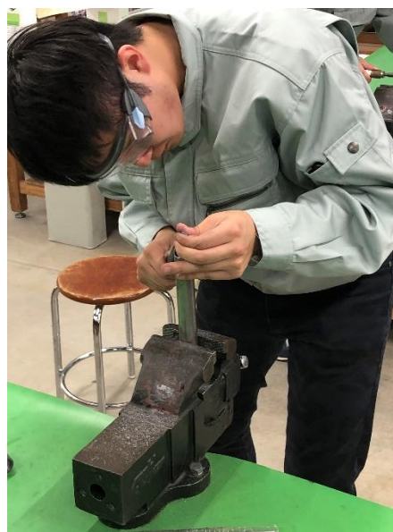
図3 フレーム班班体験の様子

4月に新しくチームに加わってくれた新入生に、フレーム班、エアロダイナミクス班、パワートレイン班、サスペンション班のそれぞれの班で、班内のパーツの説明や、実際にパーツに触れたり、パーツの加工を行いました。下記図3はフレーム班の班体験の様子です。フレーム班は新入生にグラインダー、やすりを使用して丸パイプのすり合わせと溶接を体験してもらいました。