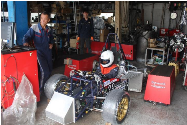
図5 パワーチェックの様子

22日には、スポンサー様である株式会社トラップ様を訪問し、シャーシダイナモを使用した車両のパワーチェックをお願いしました。大会中に調整を行った燃調でパワーチェックを行ったところ、8月23日に行ったパワーチェックよりも良い結果を得ることができました。ご支援くださりありがとうございました。以下の図5はパワーチェックの様子です。